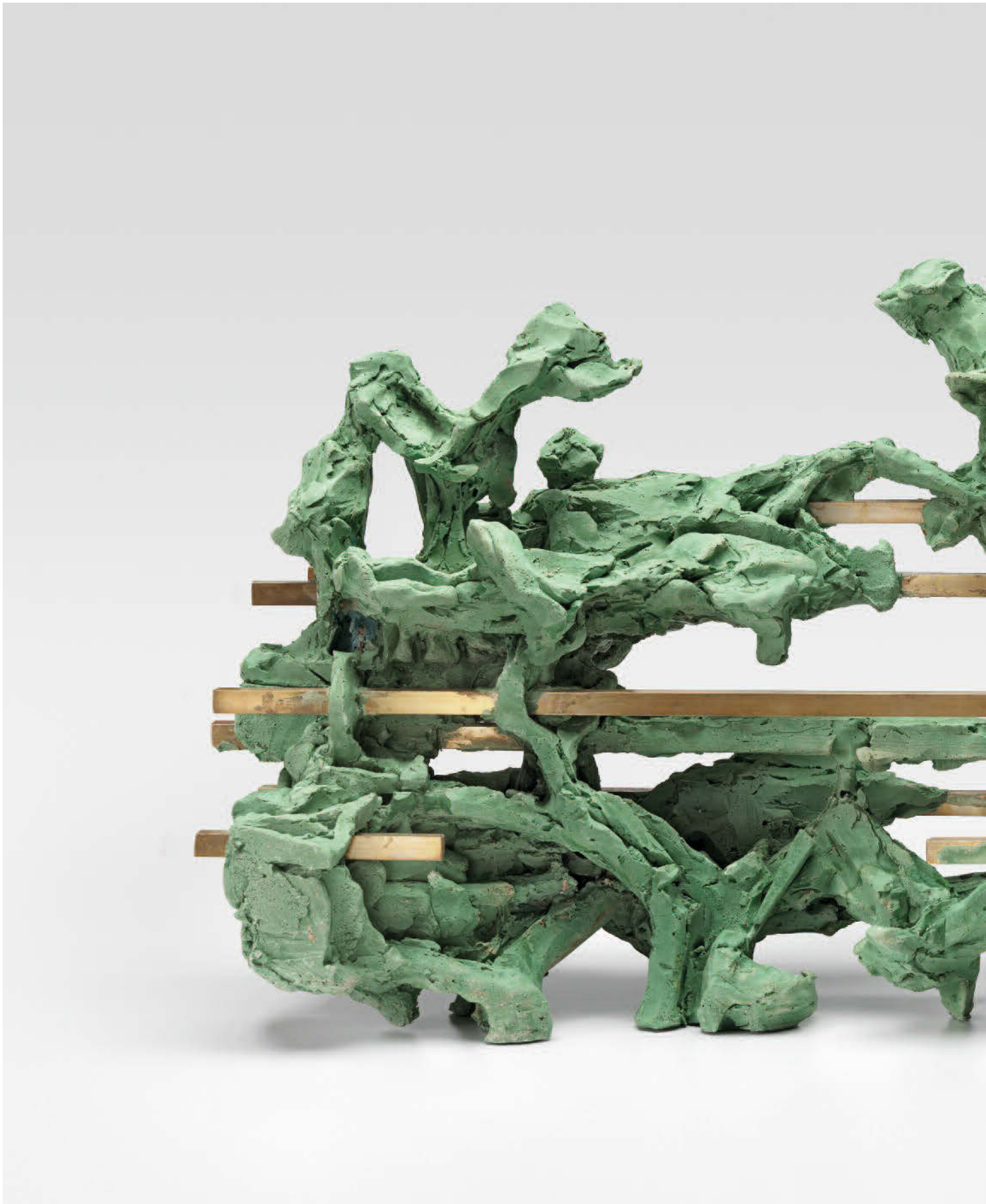
Lucy Teasdale, The Mustering , 2018, Acrylcast, 36 x 66 x 22 cm