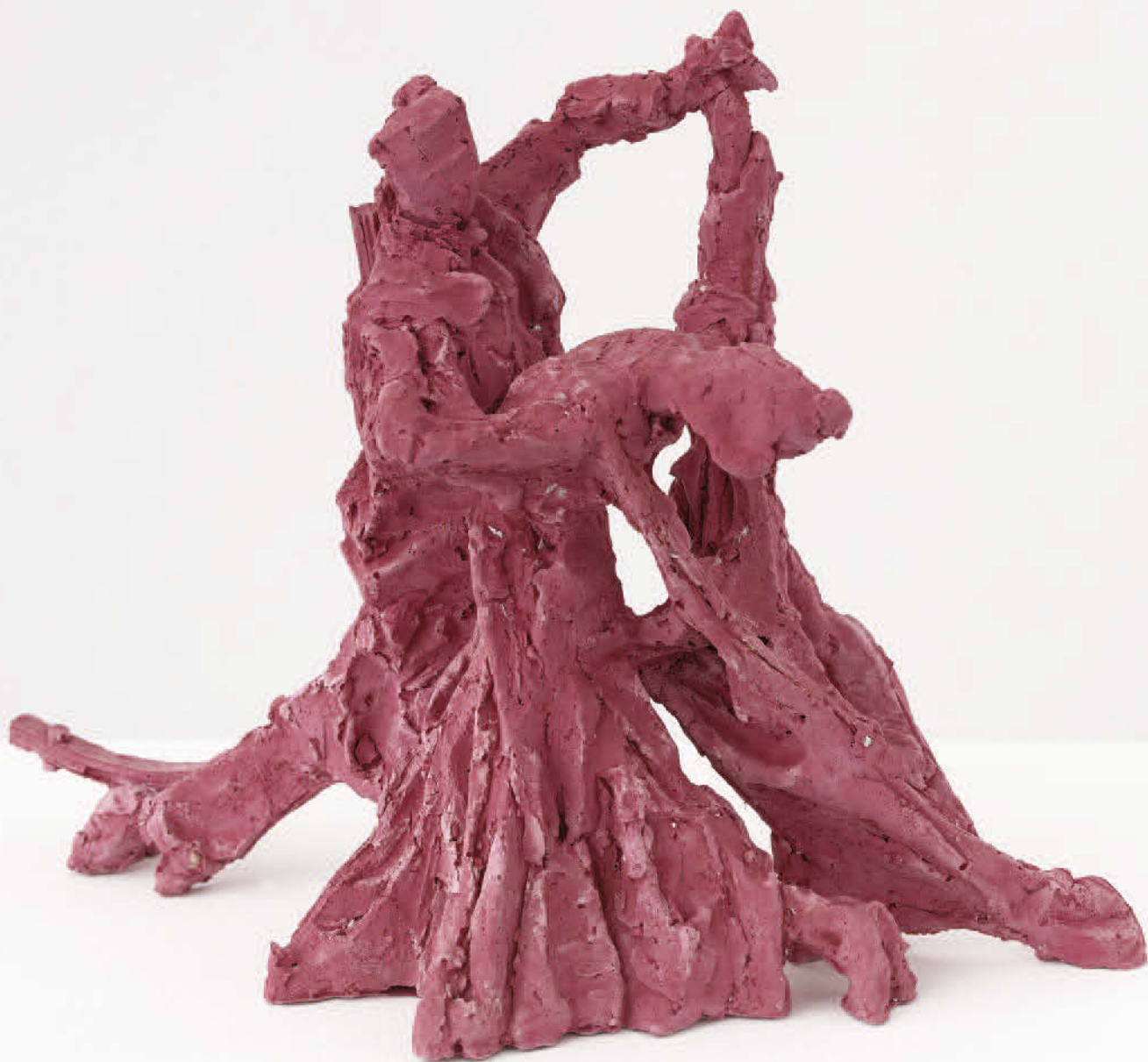
Lucy Teasdale, Dancers , 2018, Acrystal, 29 x 40 x 23 cm