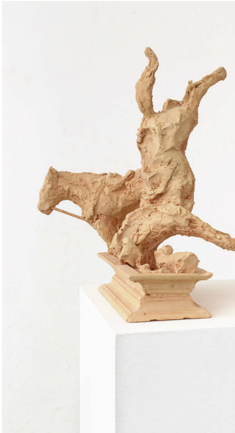
Lucy Teasdale, Grandly National , 2018, Acrylax, 36 x 66 x 22 cm