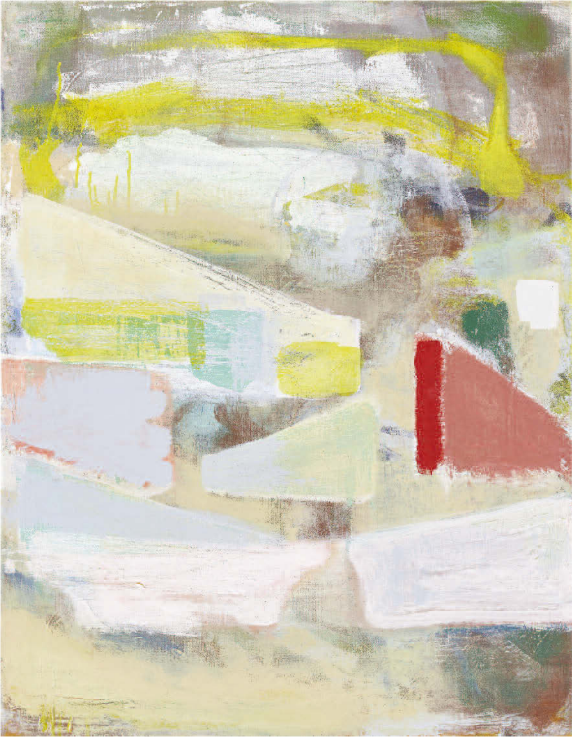
Michael Markwick, Sky Waiting for Kites, 2018, Acrylic on linen, 90 x 70 cm