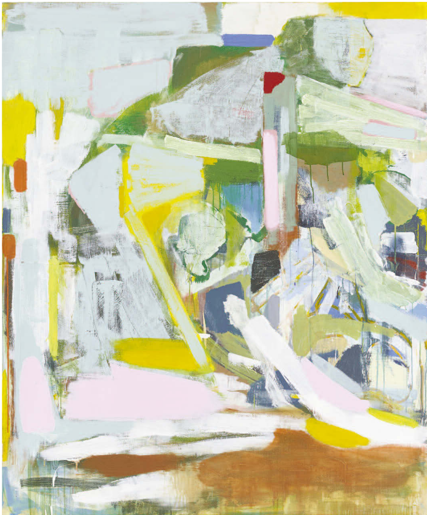
Michael Markwick Poet Climbing out of the Earth, 2017, Pigment, binder and mixed media on linen, 180 x 150 cm