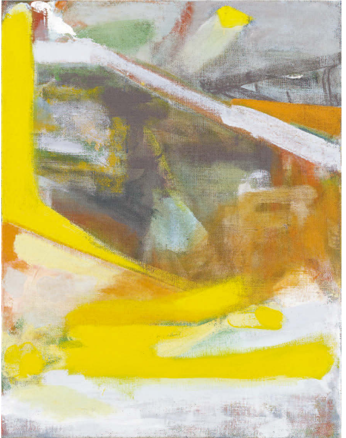
Michael Markwick, Bird Waiting for Storm, 2018, Acrylic on linen, 90 x 70 cm