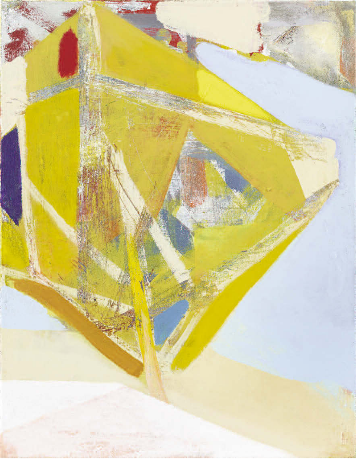
Michael Markwick, Ghost Kite, 2018, Acrylic on linen, 90 x 70 cm