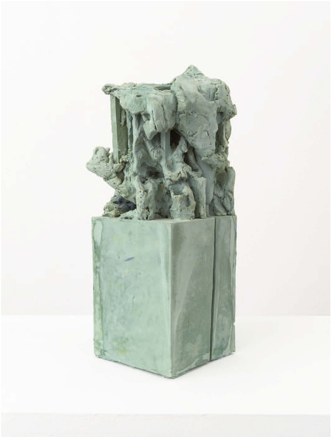
Lucy Teasdale, Lift , 2018, Acrystal, 29 x 40 x 23 cm