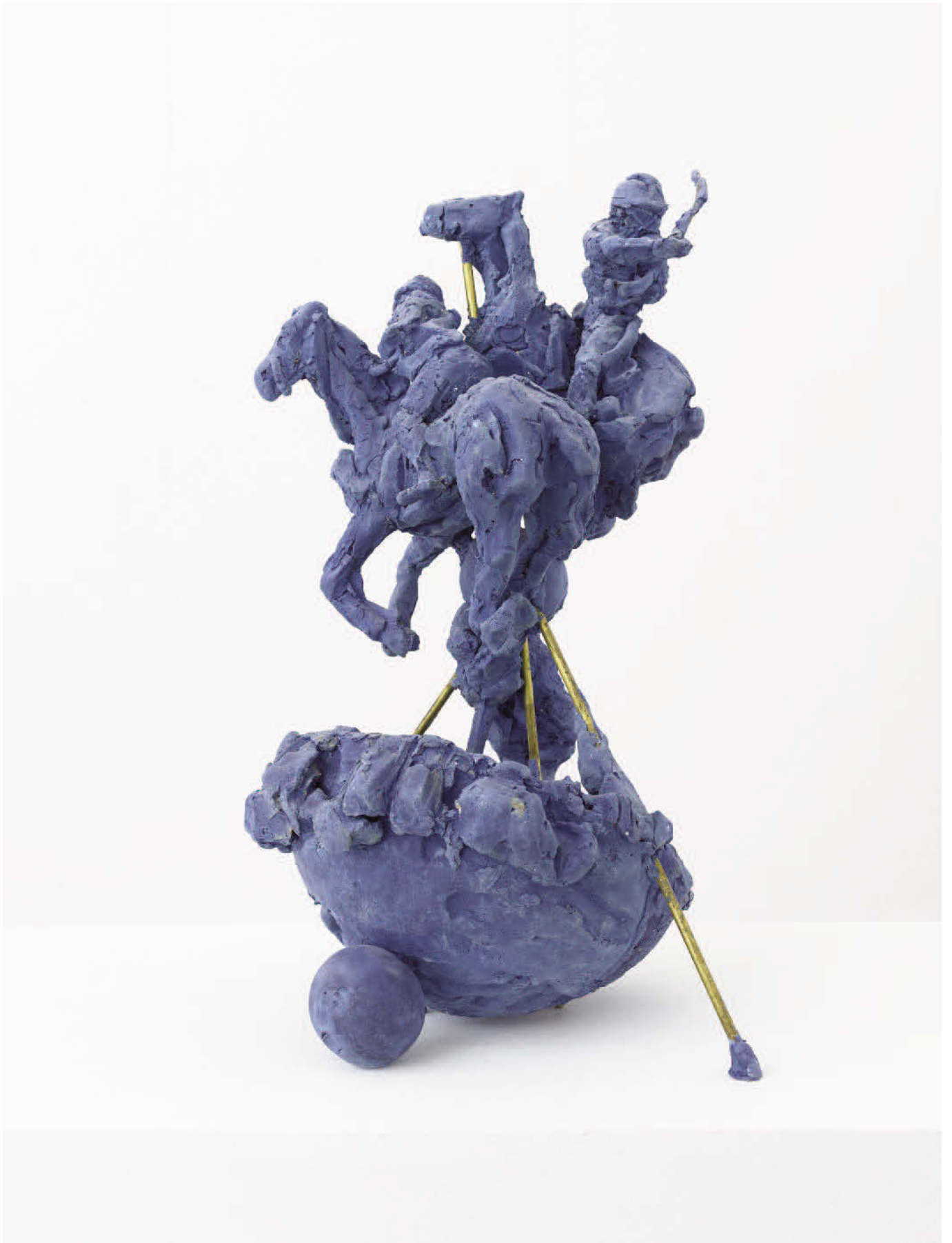
Lucy Teasdale, Polo! , 2018, Acryal, 52 x 28 x 28 cm