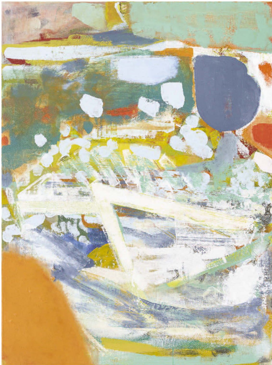
Michael Markwick, Sailor on the Styx, 2018, Acrylic on linen, 120 x 90 cm